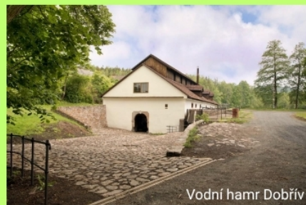
Vodní hamr Dobřív

Více tipů najdete na www.rokycanskonepomucko.cz .