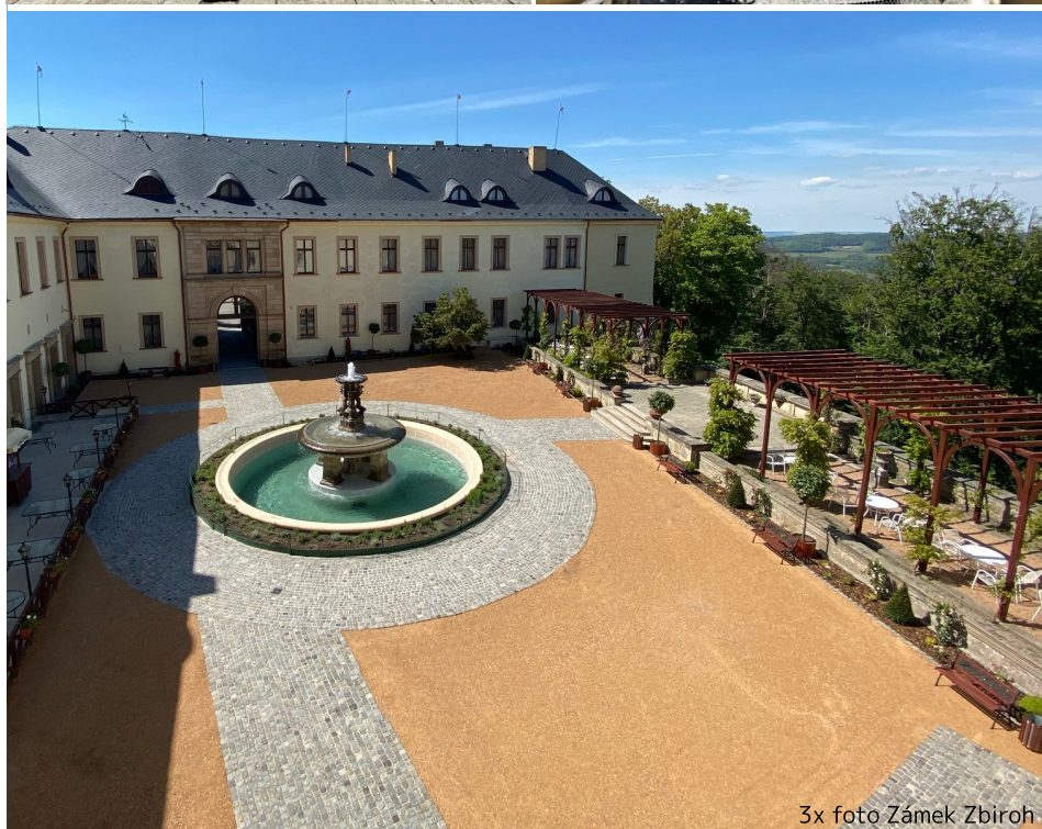
3x foto Zámek Zbıroh

Město Zbıroh nabízí možnost bezplatné inzerce v Měsíčníku Zbırožsko pro místní podnikatele a živnostníky . Text inzerátu nebo inzerát v grafické podobě ve formátu jpg, pdf zašlete na e-mail: zpravodaj@zbiroh.cz . Bližší informace na tel.: 371 794 030.