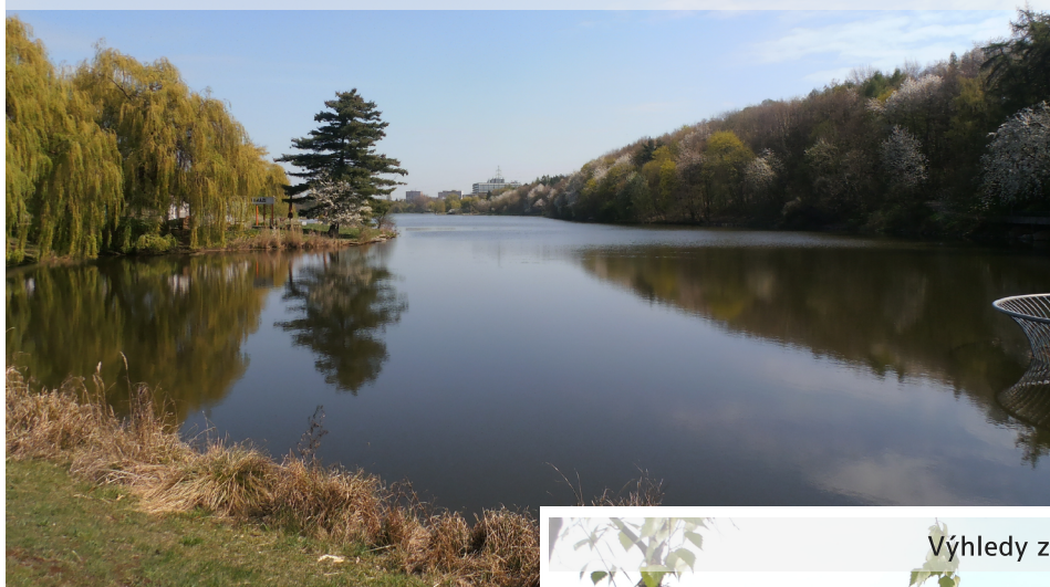
Přírodní koupaliště Džbán

Vystupujeme na Hlavním nádraží a pokračujeme tramvají. Proveze nás velkou částí Prahy. Vysedáme až na konečné tramvaje u Divoké Šárky. Sejdeme po schodech do údolí a divočina je tady. Vcházíme mezi vysoké skály, kudy vede cesta, kterou pod skalami provází i Šárecký potok. Jsou na něm vodopádky, které bravurně překonávají malé šikovně kachničky. Okolní skály jsou vysoké a rozervané. Je tady nádherně. Jdeme sevřeným údolím a najednou se skály rozestoupí a před námi je rozsáhlá louka s koupalištěm napájeným potokem. Je oplocené a přes plot vidíme k velkému bazénu a vodním atrakcím. Vše je v tuto ranní dobu bez návštěvníků. Tady už louka končí a údolí opět začínají svírat vysoké skály. Potok nás ale neopustil a pokračuje s námi. Po nějaké chvíli docházíme k hostinci se jménem Dívčí skok. Na jedné z budov je malba, kterou si připomeneme pověst ze „Starých pověstí českých“. Je zde zobrazen Ctirad a Šárka. Naproti hostinci, nad údolím, se tyčí vysoká skála nesoucí příznačné jméno „Dívčí skok“. Odtud se ale pochopitelně na skalní vyhlídku nemůže. Tam se musí dojít z jiné strany, kam také máme namířeno. Ale napřed musíme projít celou Šárkou. Všude okolo nás se střídají skály