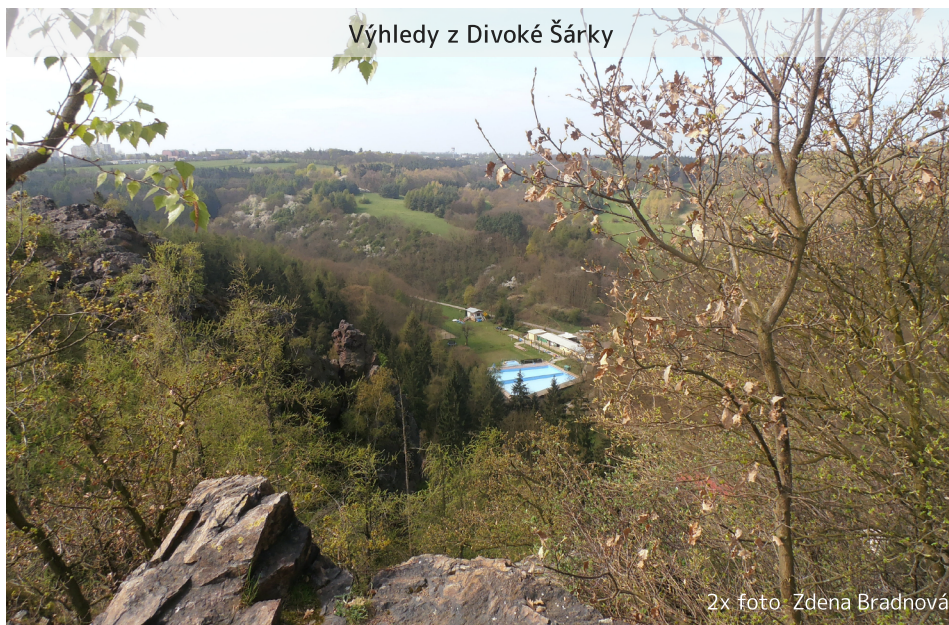
Výhledy z Divoké Šárky

Turistická značka nás nyní vede do údolí k rozsáhlé vodní nádrži Džbán. Než tam ale sejdeme, opustí nás sluníčko, které bylo celý den s námi. Obloha od Ruzyně najednou potemněla, je úplně ocelová a začínají padat první kapky deště. Schováme se pod blízký strom, a to už prší. Déšť začíná nabírat na síle a mění se v opravdový liják, který jak rychle přišel, tak naštěstí poměrně rychle odešel. Jdeme po hrázi nádrže, nikdo se nekoupe, ale my jsme za tu chvíli mokří, jako bychom z vody vylezli. Docházíme do míst, kde jsme ráno do soutěsky vs-