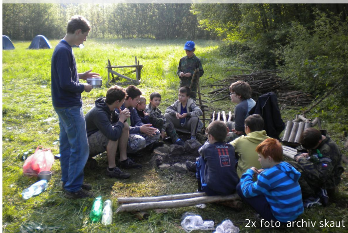
Květen 2010 - ráno při přespávání na Jablečné

Středisko se stabilizovalo na 3 oddíly, tedy dívčí, chlapecký a oddíl oldskautů. Tento oddíl tvořili starší činovníci, kteří pomáhali ve střediskové radě, ale fakticky mládež nevedli, nebo i prostí podporovatelé skautské myšlenky, protože skautskou výchovu prožili v mládí na vlastní kůži. Činnost nabývá pestrosti a jsou i jisté pokroky ve snaze o materiální zajištění. U dívek dvakrát dochází k nedostatku vedoucích pro vedení letního tábora a tábor jejich kmene se tak nekoná. Ze stejného důvodu se v tomto období konají tábory v letech