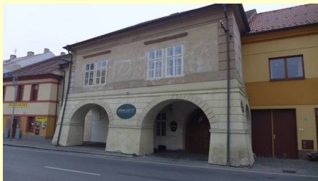
Dům čp. 54 v Žebráku

Hejtman de Bois vlastnil dům v Žebráku na náměstí, dnešní čp. 54. Dům společně s manželkou Annou jej zakoupil za 1 000 zlatých od Alžběty Kolencové, po smrti jejího manžela Jana Kolence z Kolna, hejtmana na Zbiroze. Dnešní dům čp. 54 stojí na místě tří samostatných středověkých domů, které byly později spojeny v jeden objekt. Nejstarší písemné zprávy o třech domech pocházejí z období po roce 1620. Dům je památkově chráněný od 16. 12. 2008. Dnes se v přízemí nachází Restaurant Genius Loci.