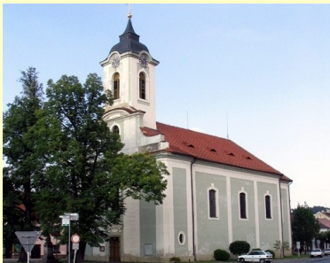
Kostel sv. Vavřince v Žebráku