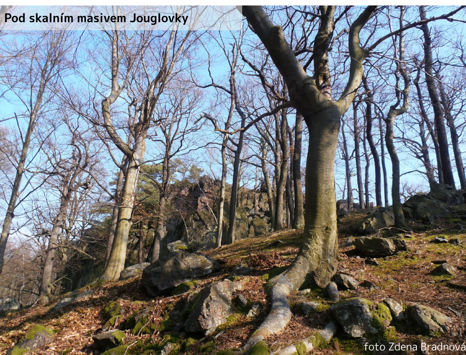
Pod skalním masivem Jouglovky

jdeme po ní ale dlouho a odbočujeme na lesní cestu vpravo, která je bez TZ. Doufáme, že nás odvede k hájovně Bušohrad. Bohužel po nějaké chvíli se nám zdá, že je horší a horší a že už to snad ani cesta není. Najednou se ale znovu objeví a odvede nás na silnici přímo k hájovně. Za pochodu jsme trochu nasýtli prosící těla, nesmíme je příliš týrat. V těchto místech u Bušohradu se kdysi odehrály velké střety mezi myslivci a pytláky. Pokračujeme po silnici, která by nás odvedla až do Skryjí nebo do Podmokel. Ale nebojte se, tam až nedojdeme. Odbočíme u dalšího rozcestníku na TZ, která nás odvede na vrch Vlastec. Cesta stoupá do prudkého kopce. Vede nás