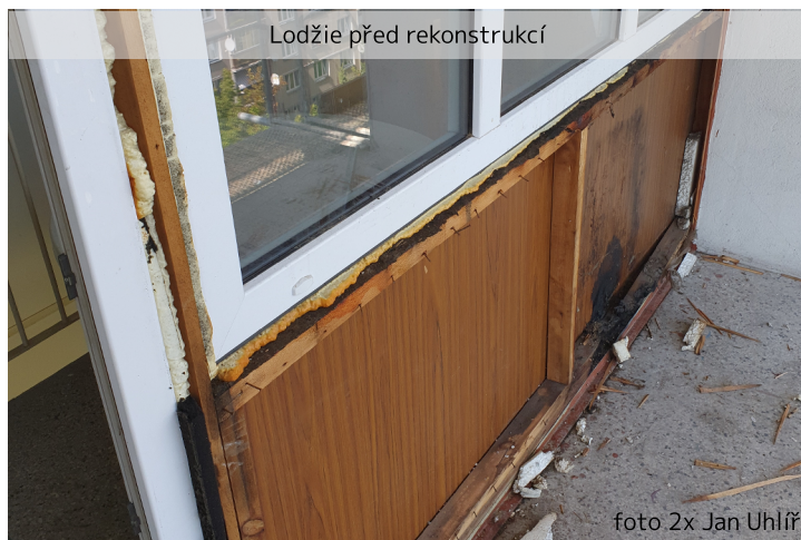
Lodžie před rekonstrukcí