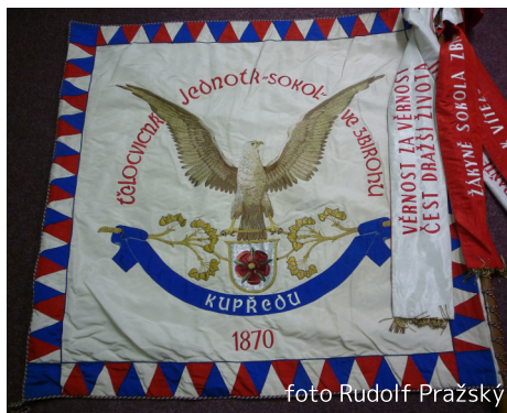
Prapor zbizožských Sokolů

1949 – V měsíci lednu byl soudní okres ve Zbizoze zrušen a přestěhován do Rokycan a sloučen s okresem rokycanským. Při této změně byly odděleny k soudnímu okresu do Hořovic obce: Kařízek, Jivina, Kvaň, Olešná, Zaječov,