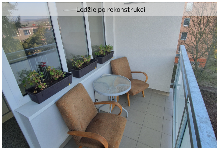
Lodžie po rekonstrukci

a 524 ul. Zd. Nejedlého, Zbiroh" od Ministerstva pro místní rozvoj ve výši 31,5 % uznatelných nákladů.