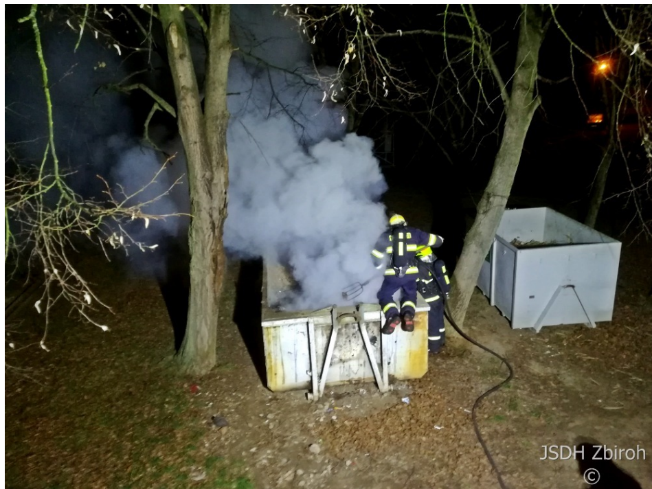
JSDH Zbiroh ©