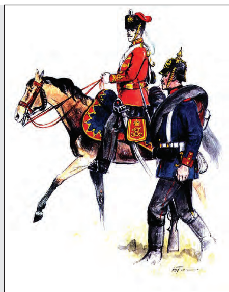
Prusko 1866 – mušketýr a gardový husar.