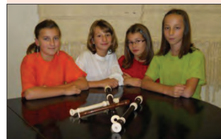
První členky Komoráčku.