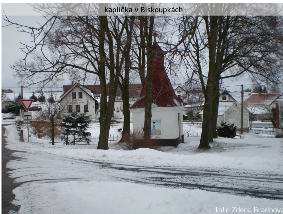
kaplička v Biskoupkách

Je zima, poletuje sníh, fouká vítr, je mlhavo, ale batohy i my jsme v pohotovostním stavu. Co bychom také v této roční době čekali. A tak zima nezima, prostě se jde. Naše putování se nyní orientuje na blízké okolí. Dnešní výchozí bod je Drahoňův Újezd. Máme namířeno do chotětínského údolí, kterým se vine malebný potůček Koželužka. Údolí je dnes tiché, zasněžené, chaty nad potokem jsou prázdné. Jako proud sněžné řeky se valí v okolí potoka mlha. Jdeme cestou směrem k Chotětínu, malé vesničce, která je obklopena lesy. Dříve zde stávala tvrz, která byla opuštěna již v 16. stol. Míjíme malý rybníček, jeho hladinu svírá slabá vrstva ledu. Tady stávala zmíněná tvrz. Chaloupky jsou dnes také tiché, téměř nikdo zde trvale nebydlí. Zdejší chalupy jsou využívány ponejvíce k rekreaci. Projdeme vyhlídne-