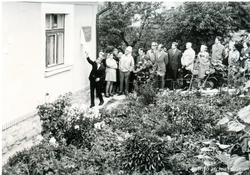
Odhalení pamětní desky J. Heyrovskému, Kařez čp. 19